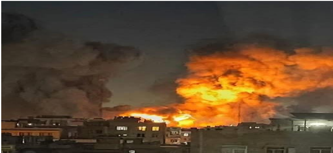
Bombardements américano-israéliens (mars 2026)

Le 28 février, Les États-Unis et l'État d'Israël déclenchent une nouvelle guerre contre l'Iran. Dans la foulée, Israël en profite pour bombarder et occuper une partie du Liban.